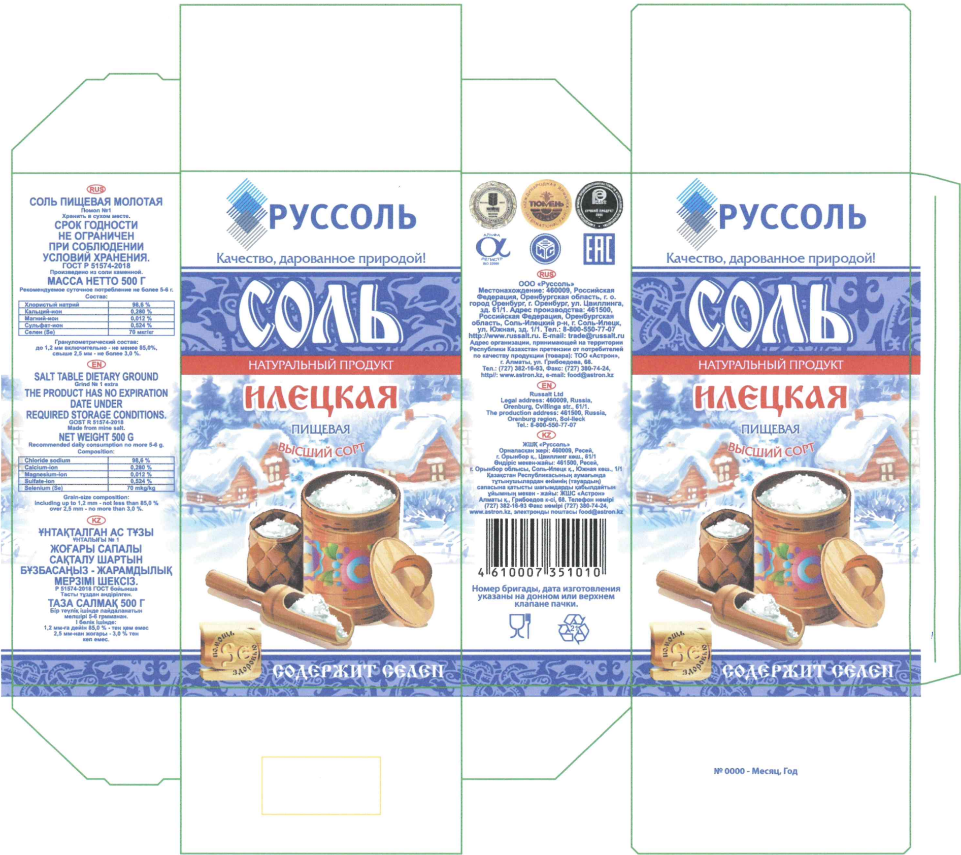
Приложение 3 к Техническим параметрам картонной пачки для соли «Илецкая» (500г) и «Sea salt» (500г) Макет пачки «Соль пищевая молотая», 500г

Примечание: Текстовая информация «Соль пищевая молотая» «Масса нетто 500г»; «Срок годности не ограничен при соблюдении условий хранения» на всех языках указывается шрифтом высотой не менее 2 мм. Текстовая информация «Произведено из соли каменной»; «Хранить в сухом месте»; «Рекомендуемое суточное потребление не более 5-6 г» на всех языках указывается шрифтом высотой не менее 0,8мм.